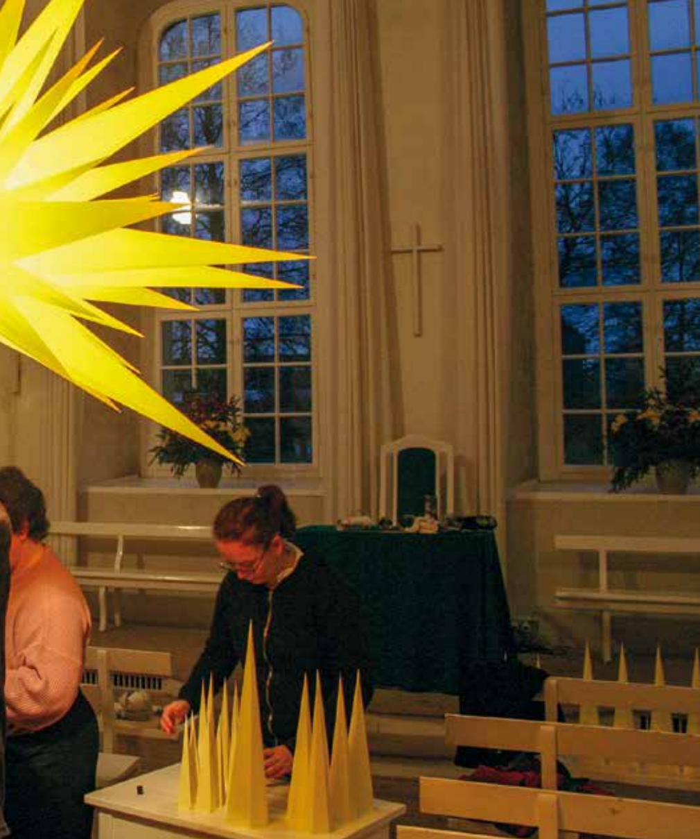
Adventsster maken in de kerk van de Broedergemeente in Herrnhut, Duitsland.

steeds minder moeten zien als kerken die ondersteund horen te worden vanuit Nederland en steeds meer als partners in de zendingsarbeid.